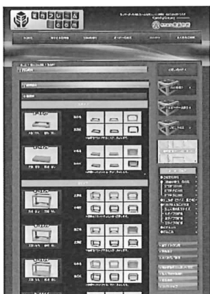
10タイプ×6材料 =60タイプ

詳しくは、電話042 —645—7330、E mail: aoi-ss@kada i-frame.com